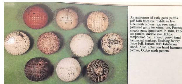
An assortment of early gutta perchabal golf balls from the middle to late nineteenth century. Top row: mesh patterned gutta for winter use. Paterson smooth gutta introduced in 1848. Knife-cut pattern. Middle row: Eclipse composition ball, smooth gutta, hand-hammered marking. Spalding factory made ball. Bottom row: Exhibition brand, Allan Robertson hand-hammered pattern, Oosbo mesh pattern.

En, zoals gezegd, vanaf 2019 droppen we stand waarbij we de bal vanaf kniehoogte loslaten. Als laatste aardigheid en om te laten zien hoe vindingrijk golfers voor alles een oplossing vinden, ook als de reglementen (nog) niet volledig in alle mogelijkheden hebben voorzien ga ik terug naar de tijd van de gutta perchabal, de "guttie".