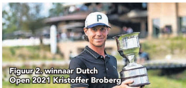
Figuur 2. winnaar Dutch Open 2021 Kristoffer Broberg

De Zweed Kristoffer Broberg mocht de wisselbeker uiteindelijk in ontvangst nemen (fig. 2), om hem ook weer meteen in te leveren, want het is een wisselbeker, nietwaar. Hij kreeg wel een andere beker mee, zodat hij thuis toch iets op de schoorsteen kan zetten (fig. 3).