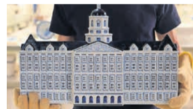
Figuur 10. replica Paleis op de Dam

Dam (fig. 10). Tot dit jaar dus. De replica was 50 cm lang, 27 cm hoog en 11 cm diep en is een gewild en waardevol bezit.