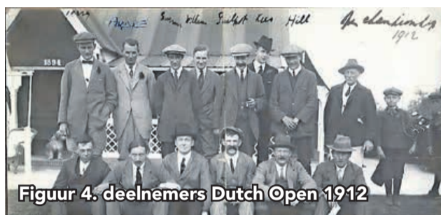
Figuur 4. deelnemers Dutch Open 1912

heeft er nog geen een de Dutch Open gewonnen. Dat zegt toch wel wat. Het was dit jaar de 101e editie in haar 109-jarig bestaan dat begon in 1912. Het deelnemersveld was nogal bescheiden (fig. 4).