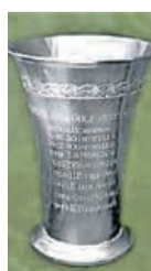
Figuur 7. Burrowsbeker, Ned. Golfmuseum, bruikleen NGF

ging nog tussen spelers van de toen bestaande clubs, de Doornse GC, de Haagsche GC, de Hilversumsche GC en de Kennemer. De winnaar van dit kampioenschap, dat wel wordt gezien als de voorloper van de Dutch Open was Walrave Boissevain van de Kennemer. U weet toch dat de huidige wisselbeker de derde Dutch Open beker is. De eerste van 1912 werd driemaal gewonnen door Henry Burrows, die de beker daarna mocht houden. Deze 'Burrows' beker (fig. 3) werd gevolgd door de 'Boomer' beker (fig. 4), die Aubrey Boomer mocht houden na eveneens driemaal winst (zelfs op rij: 1924 -1926).