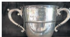
Figuur 8. Boomerbeker, Ned. Golfmuseum, bruikleen St. Andrews

Bij de derde wisselbeker, de huidige, is besloten dat die nimmer eigendom wordt van een winnaar. En maar goed ook, anders waren we al weer twee bekertjes verder. De Belg Flory van Donck spant de kroon met maar liefst vijf keer winst. Men kreeg in die tijd wel een mooi zilveren 'meeneem'bekertje mee met daarin het jaartal gegraveerd waarin men had gewonnen. Een zo'n bekertje, die van 1958 van winnaar Dave Thomas, staat in het Nederlands Golfmuseum (fig. 9).