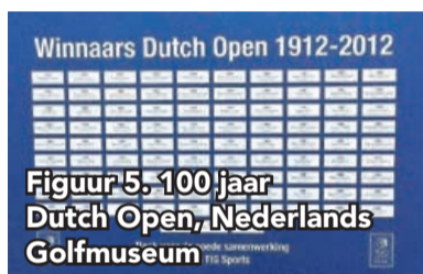
Figuur 5. 100 jaar Dutch Open, Nederlands Golfmuseum

In jaren waarin de wereld in brand stond kon niet altijd worden gespeeld. Het 100-jarig bestaan van de Dutch Open in 2012 is wel herdacht met een cadeau van KLM en TIG Sports aan de organisatie (fig. 5).