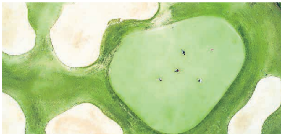
Figuur 1 Greenbunkers

Een dag niet gebunkerd is een dag niet geleefd. Dit zeg ik wel eens tegen flightgenoten, die diep zuchten bij hun eerste bunkerbal. Dat je ook teveel kunt bunkeren weet ik uit ervaring, maar toen was ik jong en speelde ik nog geen golf. Nu wel en ik ben nog altijd geen fan van bunkers. Dat pro's over het algemeen liever in een bunker liggen, dan ergens op een rand in vervelend gras zegt veel. In elk geval genoeg over het niveauverschil met mij en nog een heleboel andere amateurs, hoewel ik in mijn jonge jaren graag in de zandbak speelde en met mijn ouders naar het strand van Scheveningen ging.