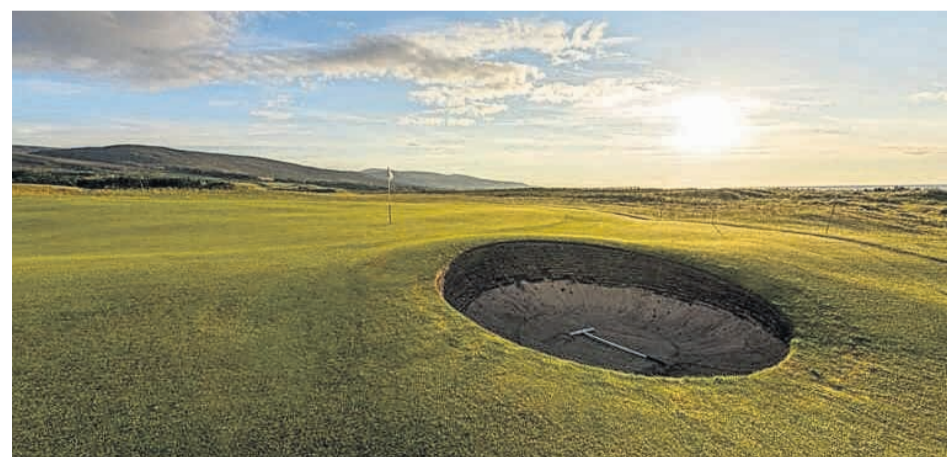
Figuur 4 potbunker