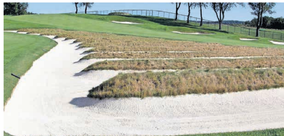
Figuur 2 Crossbunker

De eerste bunkers waren namelijk door schapen aangelegd. Op de schrale gronden aan de kust zochten zij beschutting tegen de wind, die aan zee altijd waait. Prima terreinen om te golfen vond men.