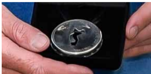
Gerard de Wit Medaille