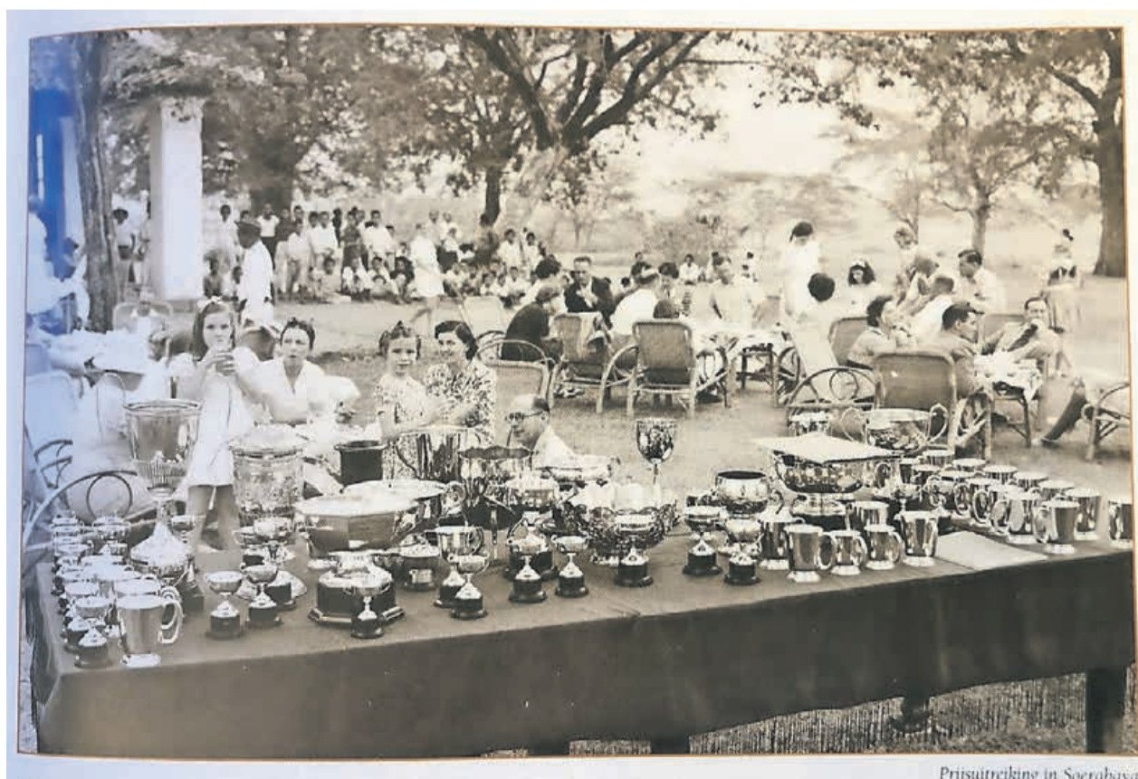
Prijstitreiking in Soerabaya

Een inkijk in de verhalen, foto's en objecten van wat uit de rijke golfhistorie van Nederlands-Indië is bewaard gebleven willen we graag bieden in een expositie over golf in voormalig Nederlands-Indië. Deze expositie zal zijn te zien in het Nederlands Golfmuseum in Afferden, Noord Limburg vanaf half oktober dit jaar.