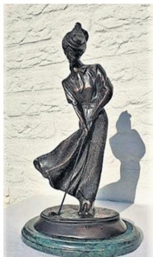
Figuur 3 Daste Dame

Van recentere datum en een jonge veelbelovende beeldhouwster zijn de twee snipe beelden (fig. 5 en 6) uit het begin van deze eeuw van de Amsterdamse kunstenaar Tosca van Oorschot (1965).