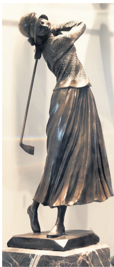
Figuur 1 Chiparus

In het Nederlands Golfmuseum vindt u enkele fraaie bronzen en stenen golfbeelden, vervaardigd door kunstzinnige beeldhouwers en beeldhouwsters, die in hun kunstwerken de vele facetten van het elegante, maar oh zo moeilijke golfspel proberen te vangen. Golfbeelden werden en worden ook gemaakt om als prijs te dienen voor een winnaar of winnares van een golfwedstrijd en ook daarvan heeft het Nederlands Golfmuseum enkele mooie exemplaren in haar collectie. In dit artikel een kijkje op deze bijzondere objecten.