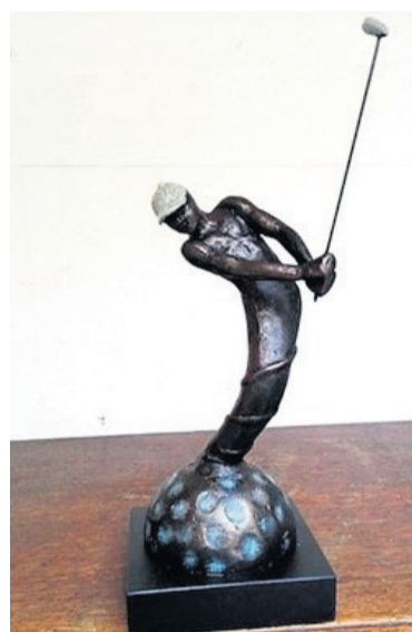
Figuur 5 Snipe Heer

Natuurlijk brengen kunstenaars ook typische golfdilemma's in beeld, zoals in het beeld 'Stumped' uit de eerste helft van de vorige eeuw (fig. 7). Hoe de bal te slaan zonder al te veel slagen te verliezen is hier duidelijk onderwerp van overleg. Het beeld is afkomstig uit Engeland, maar wie het heeft gemaakt is op het eiland achtergebleven.