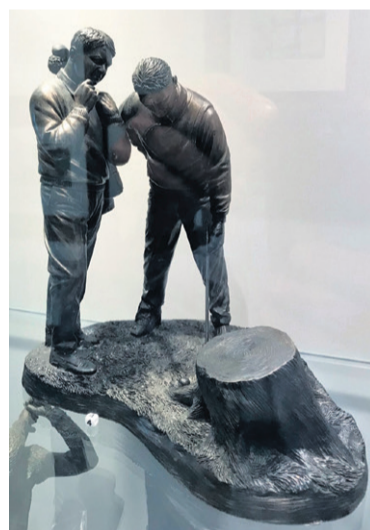
Figuur 7 Stumped

Eveneens uit Engeland, maar nu van het einde van de vorige eeuw is deze bronzen golfer, die zich knielend en mikkend voorbereid op een ongetwijfeld wat langere putt (fig. 8). En ook hier is de naam van de kunstenaar op het eiland achtergebleven.