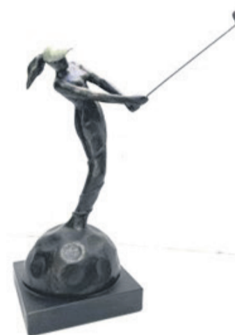
Figuur 6 Snipe Dame

Natuurlijk brengen kunstenaars ook typische golfdilemma's in beeld, zoals in het beeld 'Stumped' uit de eerste helft van de vorige eeuw (fig. 7). Hoe de bal te slaan zonder al te veel slagen te verliezen is hier duidelijk onderwerp van overleg. Het beeld is afkomstig uit Engeland, maar wie het heeft gemaakt is op het eiland achtergebleven.