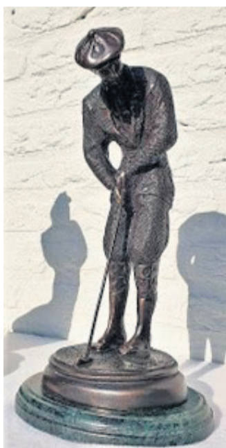
Figuur 4 Daste Heer