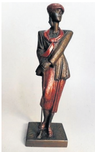
Figuur 2 Danel

Zij is gefascineerd door de verbeeldingskracht van het menselijk lichaam. Haar beelden stralen kracht en dynamiek uit en combineren abstracte en figuratieve elementen.