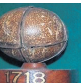
Oudst bewaard gebleven featherie bal

Hickoryhout bleek nóg beter geschikt te zijn voor golfstokken dan het hout van de Hollandse es of esp. Het is soepel en sterk en over een grote lengte knoestenvrij. Men noemt het ook wel hamerstellen hout, omdat het net als essenhout gebruikt wordt voor de stelen van hamers en bijlen. En, in de winderige en natte kuststreken van Holland en Schotland niet onbelangrijk, bestendig tegen weersinvloeden. De hickorytijd diende zich aan.