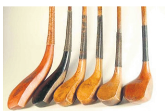
Hickorie clubs in de tijd

De stokken bleven zich aan de bal aanpassen. Toen medio 19e eeuw de hardere guttapercha bal zijn intrede deed kreeg men behoefte aan zachtere houtsoorten ter compensatie. Het betekende het einde van de long nose stokken. De houten clubhoofden werden geleidelijk dikker en ijzers waren niet langer ongewenst. Tot het eind van de 19e eeuw was beukenhout favoriet geweest voor de vervaardiging van de clubhoofden. Maar daarvoor in de plaats kwam nu persimmon hout en ijzer. Voor de