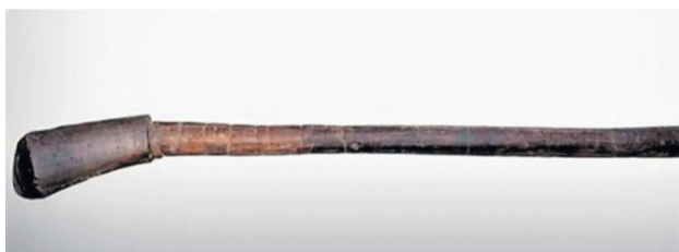
Colfstok 16e eeuw, opgegraven in Schiedam

Verder had je een iepen- of beukenhouten bal nodig. Later werden ook met haar of met veren gevulde bezaanleren ballen gebruikt.